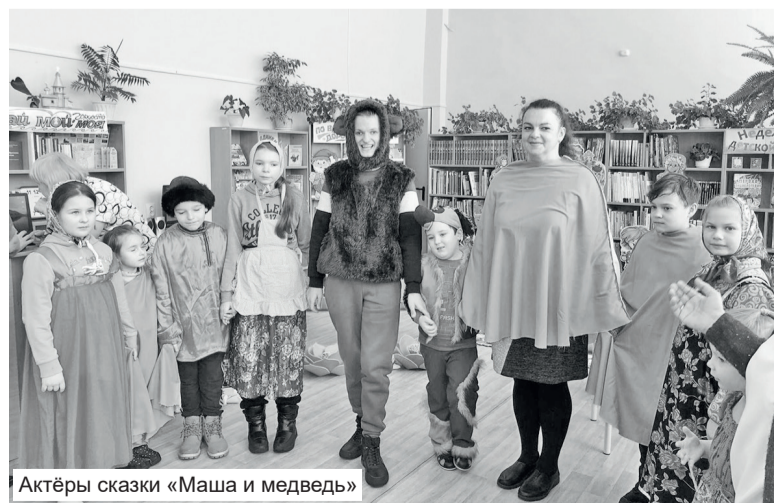
Актёры сказки «Маша и медведь»