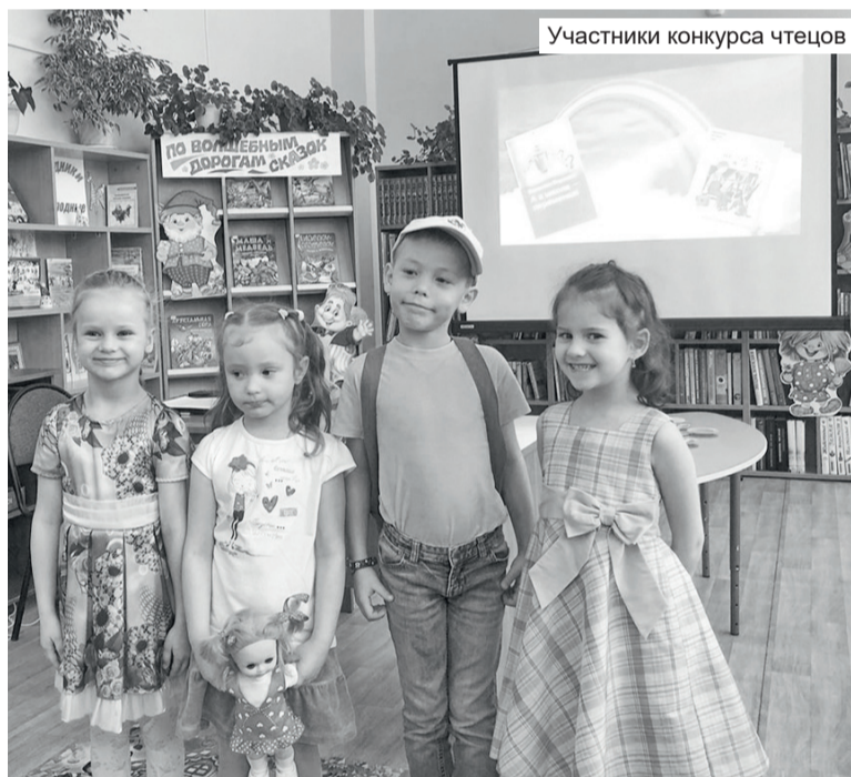
Участники конкурса чтецов

Озорные и с грустинкой, добрые и поучительные стихи Елены Благиной и Валентина Берестова звучали в исполнении малышей очень трогательно.