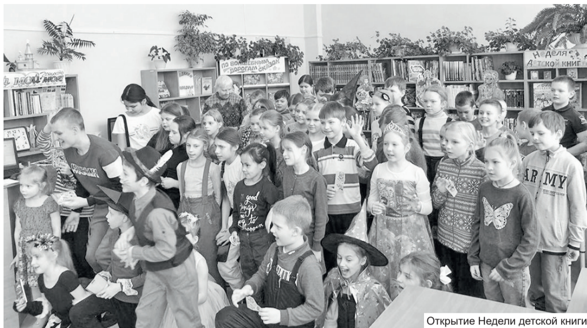
Открытие Недели детской книги

Война ушла в прошлое, но праздник детской литературы остался. С 2020 года детские