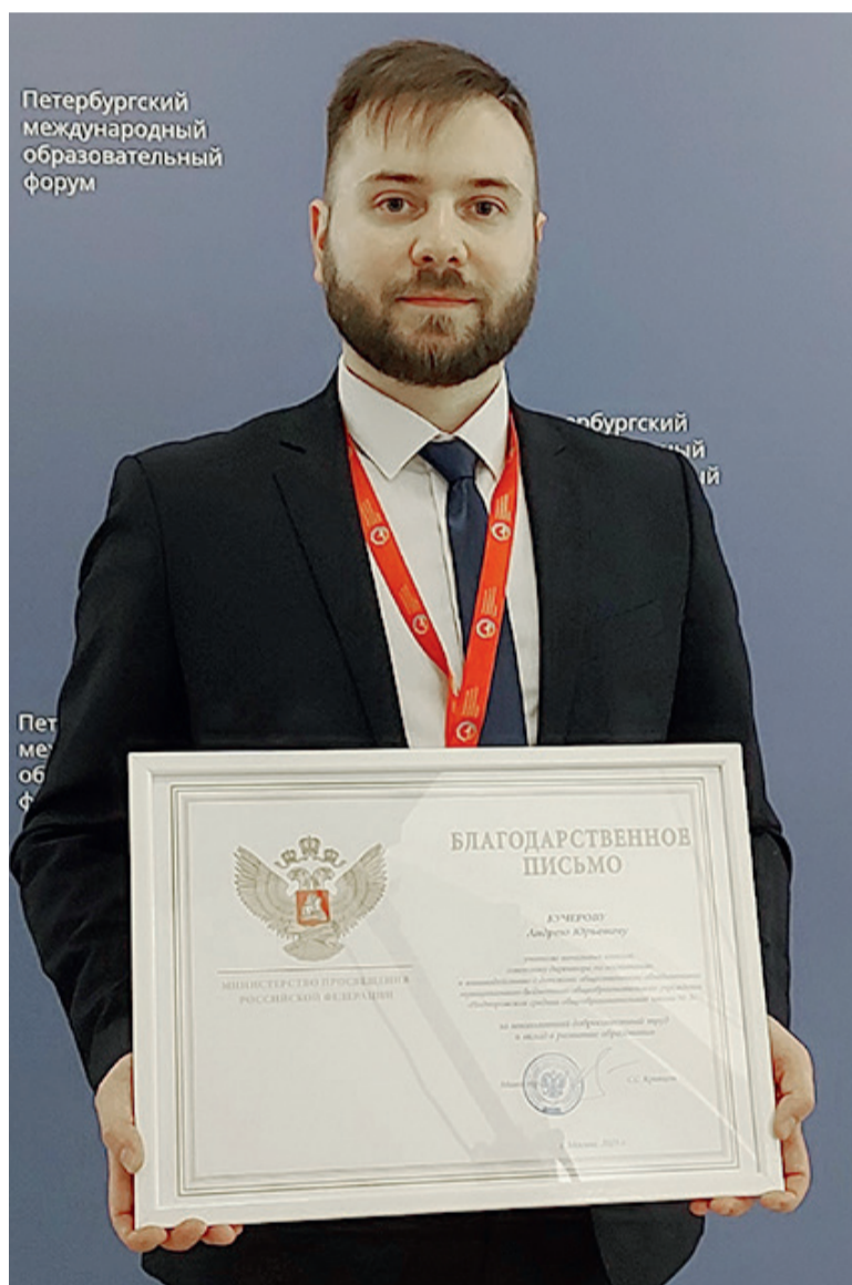
Петербургский международный образовательный форум

Отметим, на пленарном заседании XIII Петербургского международного образовательного форума состоялась торжественная церемония открытия Года педагога и наставника.