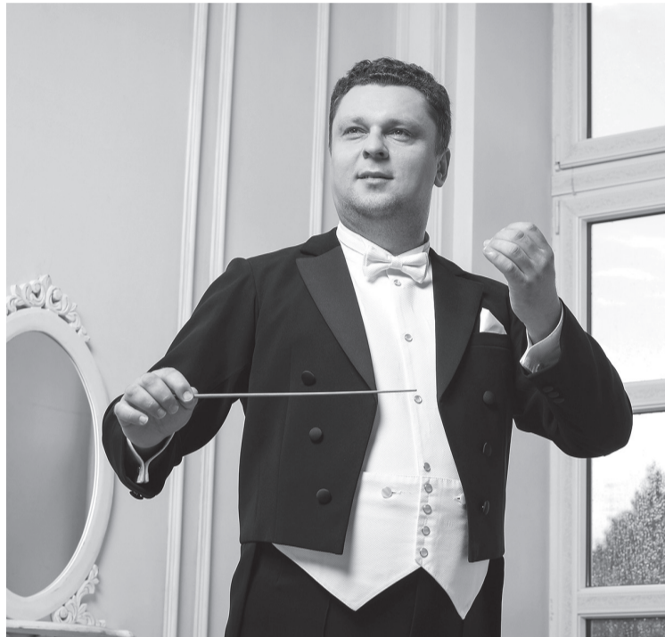
Михаил Голиков возглавляет Симфонический оркестр Ленинградской области со дня основания

что академическая музыка способна захватить эту аудиторию.